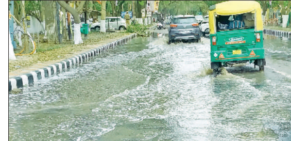
रेवाड़ी। सचिवालय रोड पर जमा बरसात का पानी व गुजरते वाहन।

सीसीटीवी कैमरे अपराध की रोकथाम तथा अपराधियों को पहचान करने में अत्यंत महत्वपूर्ण भूमिका निभाते हैं। जिले में कानून व्यवस्था को मजबूत बनाए रखने के लिए नियमित रूप से पुलिस पेट्रोलिंग तथा सीलिंग प्लान के तहत नाकाबंदी कारवाहनों की जांच की जाए।