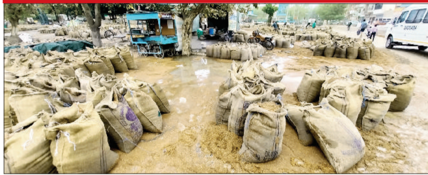
रेवाड़ी। बुधवार को आई तेज बरसात से भीगी व सड़क पर पड़ी सरसों।