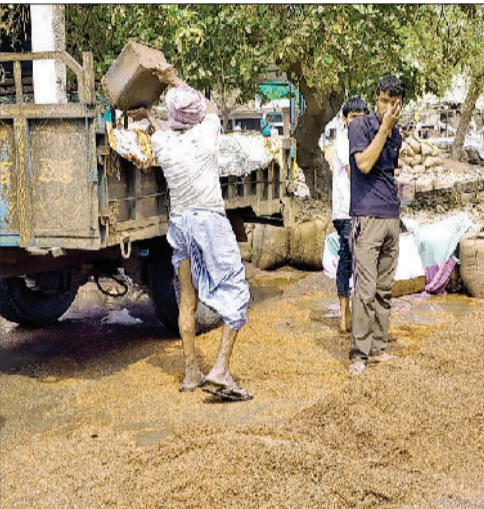
रेवाड़ी। बरसात से भीगी सरसों को ट्रैक्टर डालते हुए किसान व मजदूर।