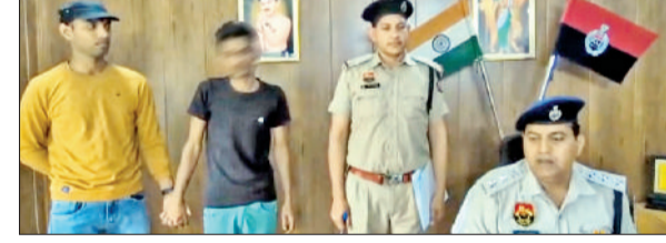
रेवाड़ी। पुलिस गिरफ्त में मंदिर में चोरी का आरोपी।

गत 13 मार्च को जाडरा के पंचमुखी हनुमान मंदिर सहित तीन मंदिरों में चोरी करने के मामले में एक आरोपी को सीआईए ने गिरफ्तार कर लिया। पूछताछ में यह बात सामने आई कि दूई सगे भाइयों ने मिलकर एक दिन में तीन मंदिरों में चोरी की चारदात को अंजाम दिया था। पुलिस ने आरोपी को कोर्ट से रिमांड पर लिया है, जबकि उसके दूसरे भाई की तलाश की जा रही है। पुलिस