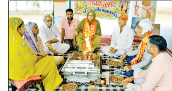
रेवाड़ी। हिंदू नववर्ष पर हवन में भाग लेते कोसली आर्य समाज के सदस्य।

की नियुक्तियां भी की गई हैं। अतः आवश्यक आधारभूत संरचना एवं शैक्षणिक संसाधन पहले से ही उपलब्ध हैं, जिससे विद्यार्थियों को उच्चतर शिक्षा प्राप्त कर अनेक विद्यार्थी विभिन्न उच्च पदों पर आसीन होकर क्षेत्र एवं राज्य का नाम रोशन कर चुके हैं। वर्तमान