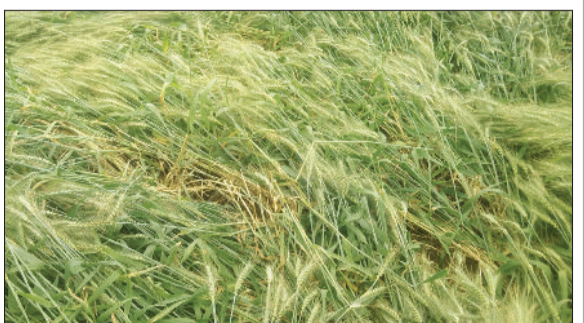
रेवाड़ी। एक खेत में ओलावृष्टि से बिछी गेहूं कर फसल।

बुधवार देर शाम आंध्र व ओलावृष्टि के साथ हुई तेज बरसात से खेतों से मंडी तक किसानों की मेहनत पर पानी फिर गया। अनाजमंडी में किसानों व आदतियों की लाखों की सरसों पानी में बहकर बर्बाद हो गई। अनाजमंडी के तीनों फाड़ों के पास सड़क पर खराब हुई सरसों ही नजर आ रही है। खेतों में खड़ी गेहूं की फसल पूरी तरह से बिछ गई। वीरवार को अनाजमंडी में किसान व व्यापारी दिनभर बरसात में भीगी सरसों को समेटते रहे। काफी किसानों को तो अपनी सरसों को ट्रैक्टर में डालकर वापस घर ले जाना पड़ा, जिससे उनको आर्थिक नुकसान और झेलना पड़ा। मौसम ने अचानक आए बदलाव ने किसानों की परेशानी बढ़ाने का काम कर दिया है। किसानों की हलत यह है कि उनकी फसल खेतों में भी खराब हो रही है और मंडियों में भी। बरसात के कारण शहर की सड़कें भी जलमग्न हैं। वीरवार को भी लोगों को जलमग्न की स्थिति का सामना करना पड़ा।