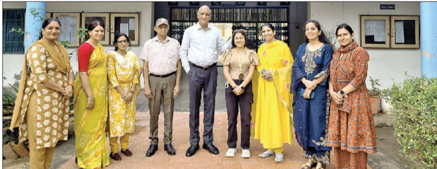
रेवाड़ी। छात्रा को सम्मानित करते हुए प्राचार्य व स्टाफ।