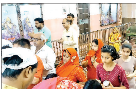
किया गया। मंदिरों में माता के अलग-अलग स्वरूपों का श्रृंगार किया जा रहा है। श्रद्धालुओं ने माता के दर्शन कर अपनी मनोकामना पूर्ण करने की मन्त्रों भी मांगी। शहर के बारा हजारी स्थित दुर्गा माता मंदिर, नई बस्ती स्थित मंसा देवी मंदिर, सेक्टर-3 स्थित माता मंदिर,