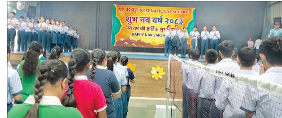
रेवाड़ी। स्कूल में हिंदू नव वर्ष मनाते हुए विद्यार्थी।

राज इंटरनेशनल स्कूल में वीरवार को हिंदू नव वर्ष यानि विक्रम संवत् 2083 का स्वागत धूमधाम और उत्साह के साथ किया गया। विद्यार्थियों और शिक्षकों ने भारतीय संस्कृति की इस अनमोल विरासत का जश्न मनाया। कार्यक्रम की शुरुआत गायत्री मंत्रोच्चार के साथ हुई, जिससे पूरा वातावरण भक्तिमय हो गया। छात्रों ने नव वर्ष के महत्व पर प्रकाश डालते हुए प्रेरक भाषण और कविताएं प्रस्तुत किए। स्कूल