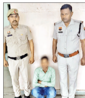
रेवाड़ी। पुलिस गिरफ्तार में ठगी का आरोपी।