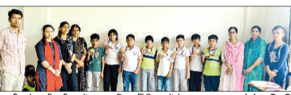
रेवाड़ी। जेएनवी परीक्षा में सफल विद्यार्थी शिक्षकों के साथ।