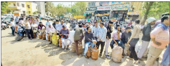
रेवाड़ी। इंडियन गैस एजेंसी के बार लगी लोगों की कतार।