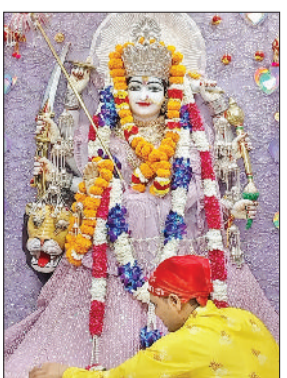
रेवाड़ी। बारा हजारी मंदिर में सजी मां दुर्गा की प्रतिमा, प्रथम नवरात्र पर दुर्गा मंदिर में माता की पूजा करते श्रद्धालु।

नवीरवार को चैत्र नवरात्र के पहले दिन शहर के मंदिरों में काफी रौनक रही। मंदिरों में कलश स्थापना के साथ मां जगदंबा की पूजा अर्चना की गई। श्रद्धालुओं ने अपने घरों में भी घट स्थापना कर माता की चौकी लगाई। नवरात्र पर शहर के सभी मंदिरों को दुल्हन की तरह सजाया गया है। नवरात्रों के प्रथम दिन श्रद्धालुओं ने व्रत रखकर मां भगवती के प्रथम स्वरूप शैलपुत्री की पूजा अर्चना की। दुर्गा मां के इस पर्व को मनाने के लिए शहर के कई मंदिरों में विशेष अनुष्ठान का आयोजन भी