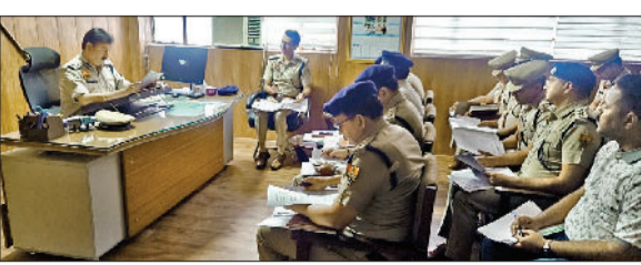
रेवाड़ी। पुलिस अधिकारियों को संबोधित करते डीआईजी।